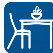
Mobiliario y Elementos de Decoración